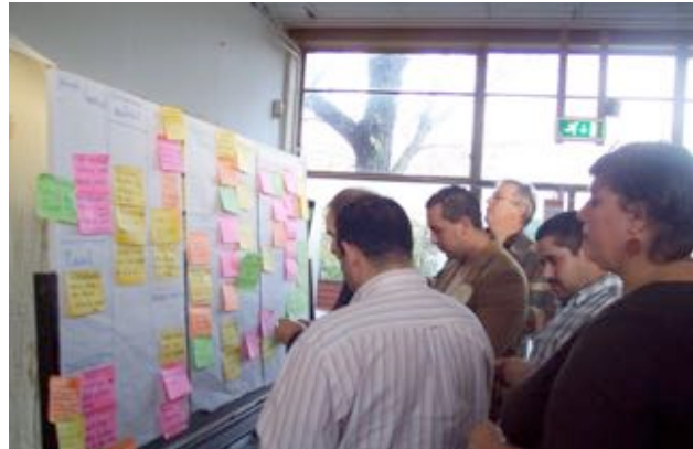
Ideeën selecteren tijdens een ideeën-brouwerij

De Ideeën-brouwerij werkt vanuit een specifieke werkmethode, die afgestemd is op de schaal van de stad, maar de methode werkt ook op buurtniveau en het niveau van een organisatie. De werkmethode is met veel plezier en succes toegepast tijdens enkele bijeenkomsten, op conferenties en in onderwijs-situaties. De werkmethode gaat uit van open deelname, in horizontale verbanden. Ideeën voor acties worden niet gelimiteerd, ieder initiatief is goed, ieder idee wordt gesteund. In groepen wordt informeel, dynamisch gewerkt, met ruimte voor het ontwikkelen van creativiteit. De aanpak is apolitiek, maar leidt wel tot maatschappelijk engagement. De resultaten staan veelal los van disciplines, instituties en professionele kaders, maar gaan vervolgens daarmee wel vaak verbindingen aan. Er bestaat in de werkmethode niet zoiets als bobo's, competitie en te verdienen punten of prijzen of andere kenmerken van de "old school".