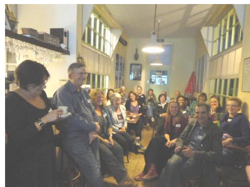
Start van het eerste Bruispunt in Gouda (29-9-10)

Tenslotte is er sprake van inkadering van het brouwen: de selectie van initiatieven kan op een bepaald werkterrein gericht zijn, zoals er brouwerijen rond klimaatverandering zijn geweest, rond woonkwaliteit, rond duurzaamheid. De brouwerijen op stedelijk en buurtniveau hebben geen thema gehad, maar de thema's ontstaan door mensen uit een bepaald gebied bijeen te brengen, waarbij de publieke omgeving sturend is bij de ideevorming. Een belangrijke stimulans en inspiratie voor nieuwe initiatieven komt van de Caleidoscoop: een snelle presentatie van al lopende projecten, wel 15-20 voorbeelden in een half uur. Tevens gebeurt het organiseren van de fysieke verbinding tussen sociaal actieven niet altijd spontaan. De Ideeënrouwerij zorgt voor een ruimte met voorzieningen, publiciteit over een Bruispunt, een agenda en taakverdeling op de avond.